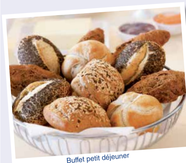
Buffet petit déjeuner

Du 26 mars au 15 octobre, tous les dimanches matin sur le bateau reliant Überlingen et Mainau (ou inversement). Veuillez consulter nos horaires.