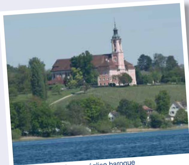
Birnau église baroque

Adultes 16,50 € / enfants 8,25 € avec la «Gästekarte» 15,50 € / enfants 7,25 €