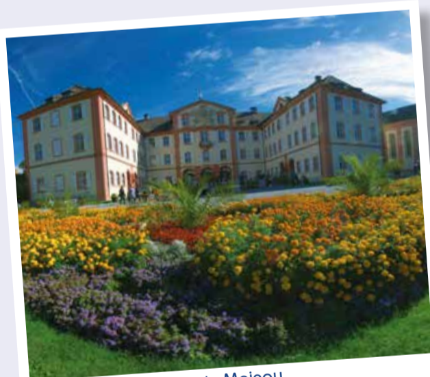
L'île de Mainau